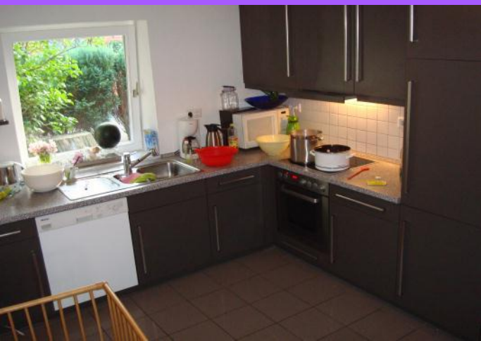
Küche und Gemeinschaftsraum EG