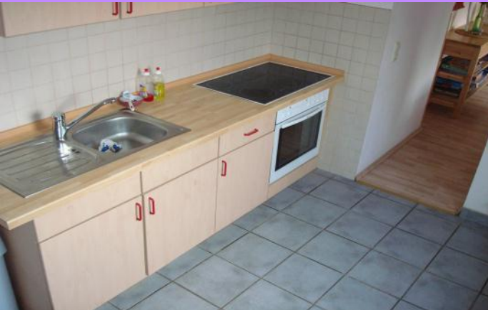
Küche und Gemeinschaftsraum 1. OG

Es stehen 2 Gemeinschaftsräume und 2 Küchen zur Verfügung